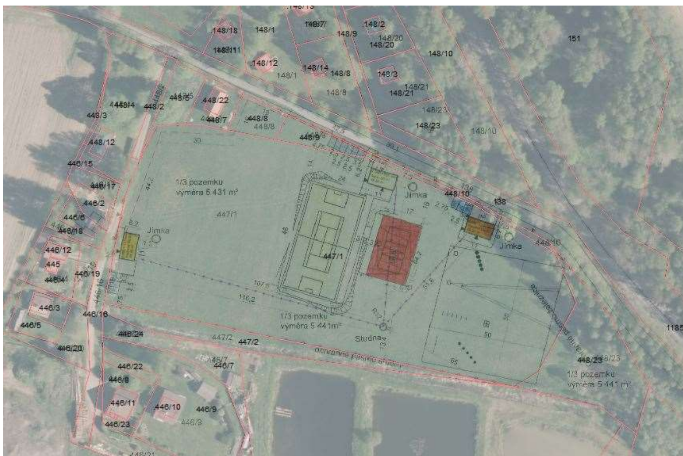
Koordinální situace – ortofoto mapa