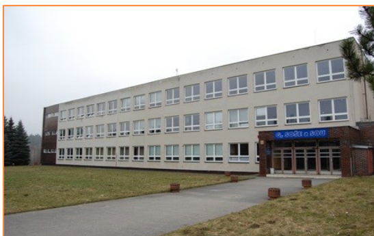
Obrázek číslo 12: Pohled na budovu Domova mládeže (Bezručova 194)(zbytný majetek pro Jč kraj)