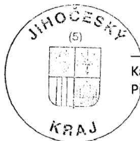
Karel Prokop Příjemce