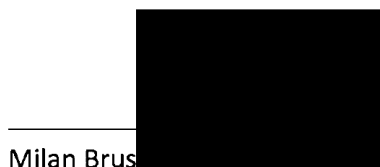
Milan Brus Příjemce