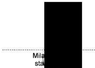
Mila stašková příjemce