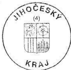
Irena Uhlířová starostka příjemce

OBEC KRASELOV Kraselov 53, 387 16 Volenice IČ: 00251364