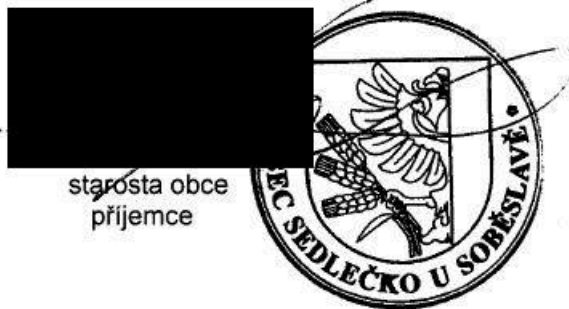
starosta obce příjemce