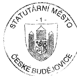
Ing. Jiří Svoboda primátor Statutárního města České Budějovice