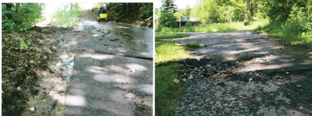
Prvotní opravy místních komunikací v době těsně po povodni