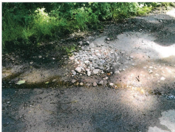
Minirypadlo - Prvotní opravy místních komunikací v době těsně po povodni