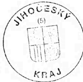
Radek Dvořák Příjemce

Příloha: Kopie oznámení o změně příjemce dotace