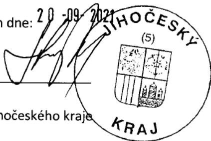
Pavel Hroch Náměstek hejtmána Jihočeského kraje Za poskytovatele