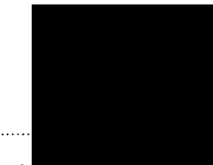
náměstek hejtmana poskytovatel