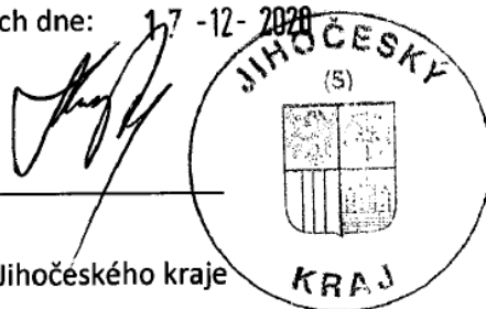
Pavel Hroch Náměstek hejtmána Jihočeského kraje Za poskytovatele

V Českých Budějovicích dne: 17. 12. 2020