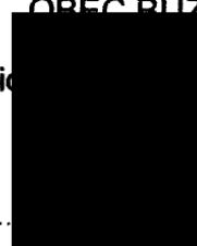
..... starosta příjemce

OBEC BUZICE KRAJ Buzice 38 01 Blatná 369 ③