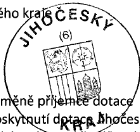
Vendula Koloušková Za příjemce