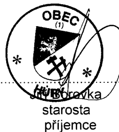
Hůřky starosta příjemce