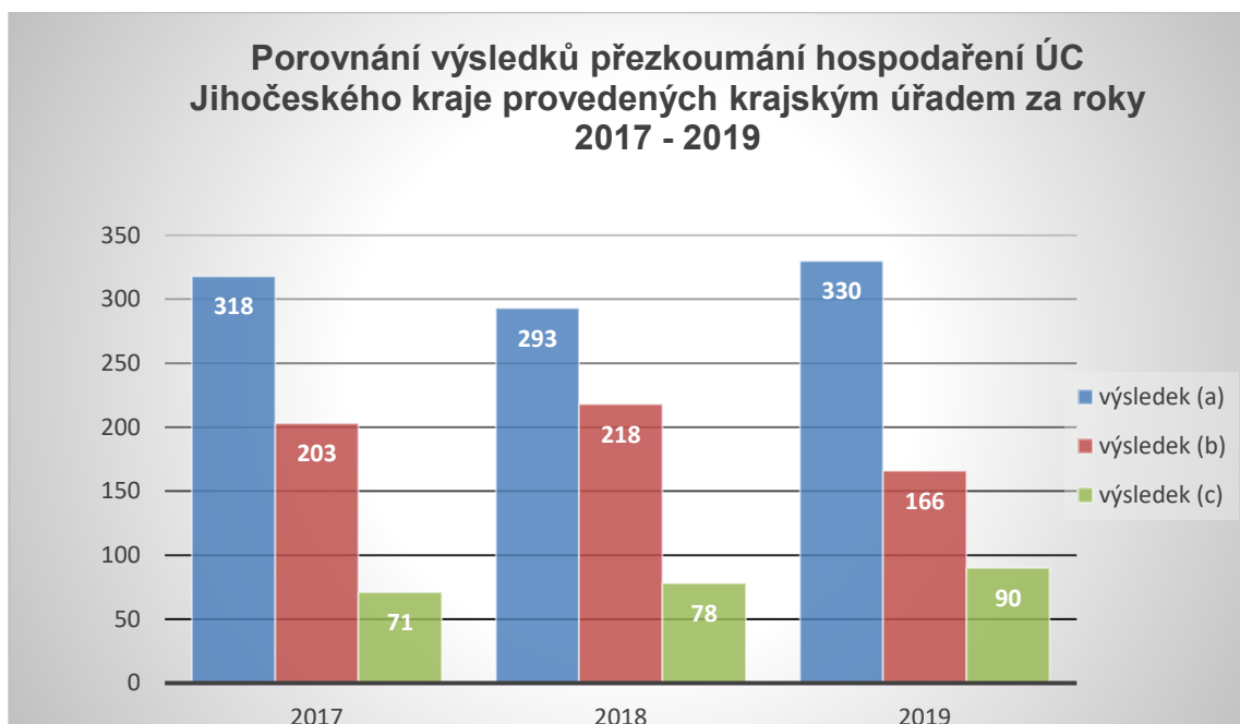
Graf č. 2 – porovnání výsledků přezkoumání hospodaření ÚC za roky 2017 – 2019

Z porovnání výsledků přezkoumání hospodaření ÚC za roky 2017 – 2019 vyplývají následující vývojové tendence: